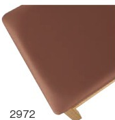
2972 茶レザー (既製品) 張地: オールマイティー L-8669 (シンコール)