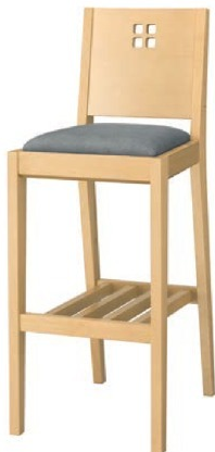
2049 空 N スタンド椅子 張地: デニム II UP-873 (Bランク)