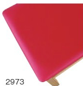
2973 赤レザー (既製品) 張地: オールマイティー L-8698 (シンコール)