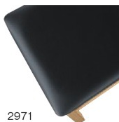
2971 黒レザー (既製品) 張地: オールマイティー L-8671 (シンコール)