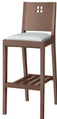
2149 空 D スタンド椅子 張地: シルキーラスタル UP-763 (Bランク)