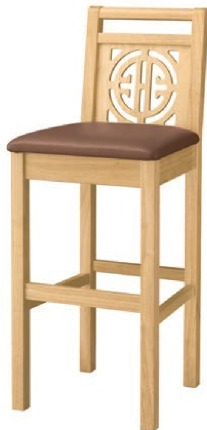
2096-2774-2972 周荘 N スタンド椅子 張地: 茶レザー (既製品)