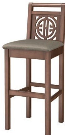
2296-2775 周荘 D スタンド椅子 張地: マニエラ L-8262 (Bランク)