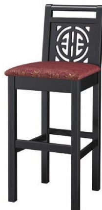
2396-2776 周荘 B スタンド椅子 張地: 松葉 L UP-1000 (Cランク)