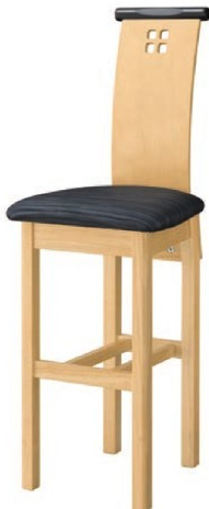
2029-1786 夕風 N スタンド椅子 張地：デコア L-8151 (Bランク)