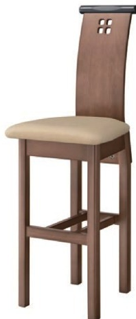
2129-1787 夕風 D スタンド椅子 張地：マニエラ L-8258 (Bランク)