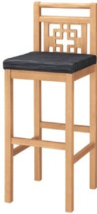
2040-2685 青島 N スタンド椅子 張地：デコア L-8151 (Bランク)