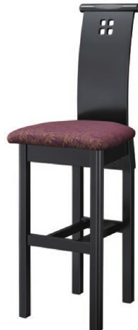
2329-1788 夕風 B スタンド椅子 張地：松葉 L UP-1001 (Cランク)