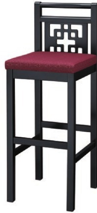
2340-2687 青島 B スタンド椅子 張地：麻葉襲 UP-995 (Cランク)