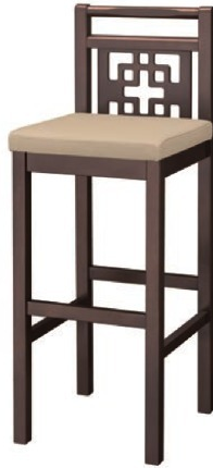
2140-2686 青島 D スタンド椅子 張地：マニエラ L-8258 (Bランク)