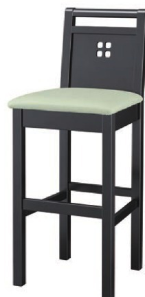
2396-2781 隠岐 B スタンド椅子 張地: マニエラ L-8249 (Bランク)