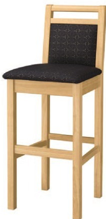
2096-2925 対馬 N スタンド椅子 張地: 麻葉葉 UP-997 (Cランク)