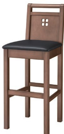
2296-2780-2971 隠岐 D スタンド椅子 張地: 既製品 (黒レザー)