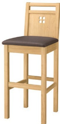
2096-2779 隠岐 N スタンド椅子 張地: 色舞 SH-12 (Bランク)