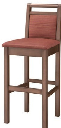
2296-2925 対馬 D スタンド椅子 張地: デコア L-8145 (Bランク)