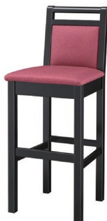
2396-2925 対馬 B スタンド椅子 張地: 色舞 SH-10 (Bランク)