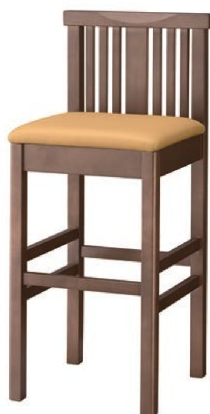
2209 矢作 D スタンド椅子 張地: プレザント PL-15 (Aランク)