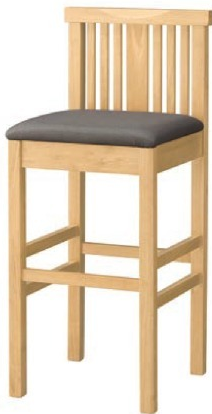
2009 矢作 N スタンド椅子 張地: マニエラ L-8262 (Bランク)