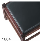
1864 黒レザー (既製品) 張地: オールマイティー L-8671 (シンコール)