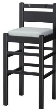
2355 阿山 B スタンド椅子 張地: シルキーラスタルUP-763 (Bランク)