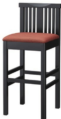
2309 矢作 B スタンド椅子 張地: デコア L-8145 (Bランク)