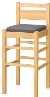
2055 阿山 N スタンド椅子 張地: マニエラ L-8262 (Bランク)