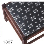
1867 カスリレザー (既製品) 張地 / カスリ