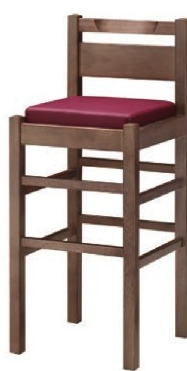
2155-1865 阿山 D スタンド椅子 張地: 赤レザー (既製品)