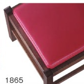
1865 赤レザー (既製品) 張地: オールマイティー L-8704 (シンコール)