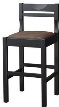
2306 関羽 B スタンド椅子 張地: デコア L-8150 (Bランク)