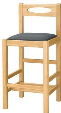
2032 室生 N スタンド椅子 張地: デニム II UP-873 (Bランク)

脚カットは、上代 1,500円 UPとなります。 (SH-510までカット可能)