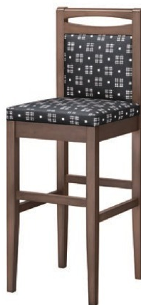
2236-1924 根室 D スタンド椅子 張地：カスリレザー (Aランク)