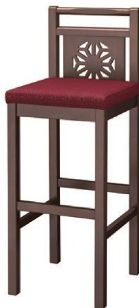
2140-2676 飛鳥 D スタンド椅子 張地：麻葉襲 UP-995 (Cランク)