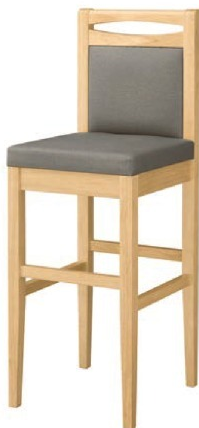
2036-1924 根室 N スタンド椅子 張地：マニエラ L-8262 (Bランク)