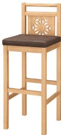
2040-2675 飛鳥 N スタンド椅子 張地：デコア L-8150 (Bランク)