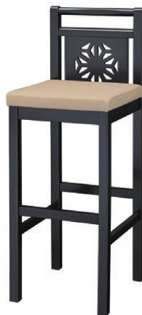
2340-2677 飛鳥 B スタンド椅子 張地：マニエラ L-8258 (Bランク)