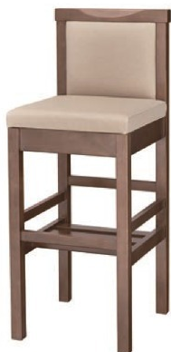
2210-1905 宇陀 D スタンド椅子 張地: マニエラ L-8258 (Bランク)