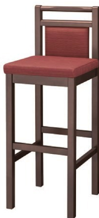
2140-2655 矢吹 D スタンド椅子 張地: デコア L-8145 (Bランク)