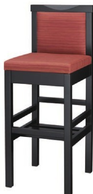
2310-1905 宇陀 B スタンド椅子 張地: デコア L-8145 (Bランク)