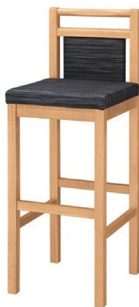
2040-2655 矢吹 N スタンド椅子 張地: デコア L-8151 (Bランク)

主 材 / ラバーウッド 塗装色 / N: ナチュラルクリヤ / D: ダークブラウン / B: ブラック