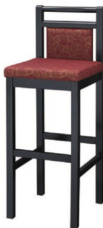
2340-2655 矢吹 B スタンド椅子 張地: 松葉 L UP1000 (Cランク)