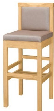
2010-1905 宇陀 N スタンド椅子 張地: シルキーラスタルUP-769 (Bランク)

主 材 / ラバーウッド 塗装色 / N: ナチュラルクリヤ / D: ダークブラウン / B: ブラック