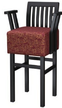
2393-1961 玄海 B スタンド椅子 1522 玄海ⅡB 背もたれ 1542×2 玄海 B アーム×2 張地：松葉 L UP-1000 (Cランク)