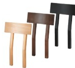
玄海Ⅰ 背もたれ 1530 玄海Ⅰ N 背もたれ 1531 玄海Ⅰ D 背もたれ 1532 玄海Ⅰ B 背もたれ ¥7,200