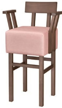
2193-1961 玄海 D スタンド椅子 1531 玄海 ID 背もたれ 1541×2 玄海 D アーム×2 張地：シルキーラスタルUP-773 (Bランク)