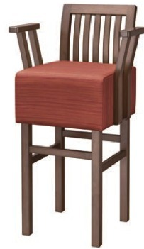
2193-1961 玄海 D スタンド椅子 1521 玄海ⅡD 背もたれ 1541×2 玄海 D アーム×2 張地：デコア L-8145 (Bランク)