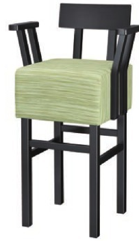
2393-1961 玄海 B スタンド椅子 1532 玄海 IB 背もたれ 1542×2 玄海 B アーム×2 張地：デコア L-8148 (Bランク)