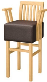
2093-1961 玄海 N スタンド椅子 1520 玄海ⅡN 背もたれ 1540×2 玄海 N アーム×2 張地：色舞 SH-12 (Bランク)