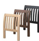
玄海Ⅱ 背もたれ 1520 玄海Ⅱ N 背もたれ 1521 玄海Ⅱ D 背もたれ 1522 玄海Ⅱ B 背もたれ ¥12,700

椅子は、053 ページをご覧ください。 座椅子は、114 ページをご覧ください。