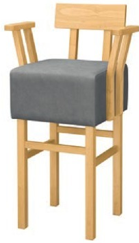
2093-1961 玄海 N スタンド椅子 1530 玄海 IN 背もたれ 1540×2 玄海 N アーム×2 張地：デニムⅡ UP-873 (Bランク)