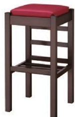
2152-1739 葛城 D スタンド椅子 張地: 赤レザー (既製品)