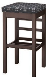
2150-1840 伊賀 D スタンド椅子 張地: カスリレザー (既製品)