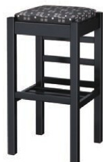
2352-1740 葛城 B スタンド椅子 張地: カスリレザー (既製品)