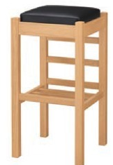
2052-1738 葛城 N スタンド椅子 張地: 黒レザー (既製品)