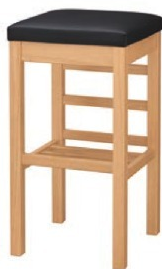
2050-1841 伊賀 N スタンド椅子 張地: 黒レザー (既製品)