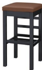
2350-1839 伊賀 B スタンド椅子 張地: 茶レザー (既製品)