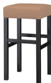
2233 保津 B スタンド椅子 張地: クレンズ II L-8529 (Aランク)