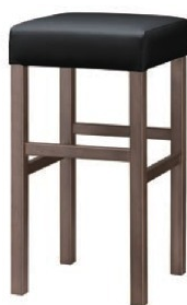
2133 保津 D スタンド椅子 張地: クレンズ II L-8534 (Aランク)