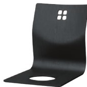
8243 羽衣 B 座椅子 ¥6,800