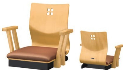
8200-8241-1923 霧島 I N 座椅子 1550×2 霧島 N アーム×2 張地：マニエラ L-8275 (Bランク)