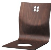
8242 羽衣 D 座椅子 ¥6,800