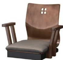
8200-8242-1923 霧島 I D 座椅子 1551×2 霧島 D アーム×2 張地：マニエラ L-8262 (Bランク)