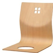
8241 羽衣 N 座椅子 ¥6,800