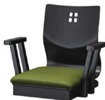
8200-8243-1923 霧島 I B 座椅子 1552×2 霧島 B アーム×2 張地：麻葉髹 UP-994 (Cランク)