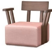
1888-1961 玄海 D 座椅子 1531 玄海 ID 背もたれ 1541×2 玄海 D アーム×2 張地：シルキーラスタルUP-773 (Bランク)