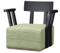
1888-1961 玄海 B 座椅子 1532 玄海 IB 背もたれ 1542×2 玄海 B アーム×2 張地：デコア L-8148 (Bランク)