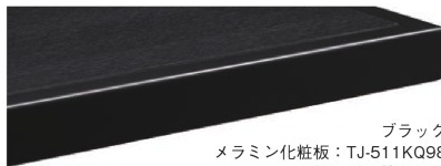
ブラック メラミン化粧板：TJ-511KQ98 指紋レス/抗菌仕様