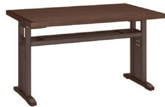
HKD 棚付 - 天美 D

脚部 4700-4706 天板 9455 W1200 × D750 × H700mm ¥93,900