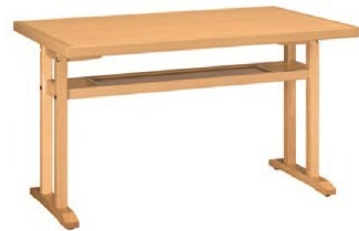
HLN 棚付 - 天美 N

W 1500 を超える別注天板の場合は、ご使用になる脚部を考慮した上で「そり止め」が必要です。 W 1510～1650 には「そり止め」を1本、W 1660～1800 には「そり止め」を2本ご使用ください。 「そり止め」は1本当たり 5,000円です。