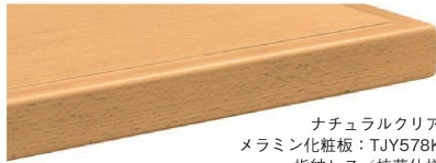
ナチュラルクリヤ メラミン化粧板：TJY578K 指紋レス/抗菌仕様