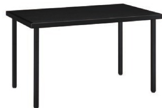
HI - 天美 B

脚部 4710-4771-4716 天板 9465 W1200 × D750 × H700mm ¥101,100