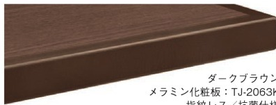
ダークブラウン メラミン化粧板：TJ-2063K 指紋レス/抗菌仕様