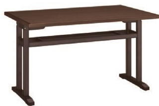
HLD 棚付 - 角島 D 脚部 4710-4716 天板 9565 W1200 × D750 × H700mm ¥93,200