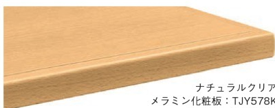
ナチュラルクリヤ メラミン化粧板: TJY578K 指紋レス/抗菌仕様