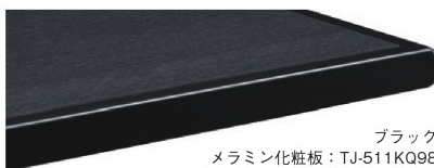
ブラック メラミン化粧板: TJ-511KQ98 指紋レス/抗菌仕様