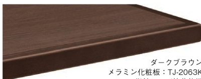
ダークブラウン メラミン化粧板: TJ-2063K 指紋レス/抗菌仕様