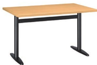
HY - 角島 N 脚部 4105 天板 9555 W1200 × D750 × H700mm ¥111,000