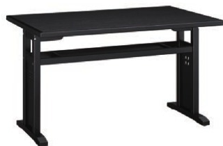
HKB 棚付 - 角島 B 脚部 4720-4781-4726 天板 9575 W1200 × D750 × H700mm ¥100,400