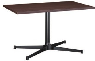
HX - 太子 D 脚部 4318 天板 9315 W1200 × D750 × H700mm ¥96,200