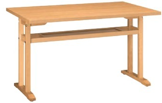
HLN 棚付 - 太子 N 脚部 4700-4706 天板 9305 W1200 × D750 × H700mm ¥85,200