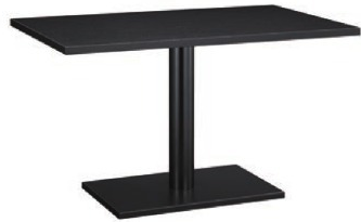
HR - 太子 B 脚部 4308 天板 9325 W1200 × D750 × H700mm ¥89,100