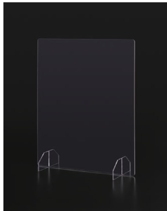
エチケット衝立 透明柄 (台湾製)