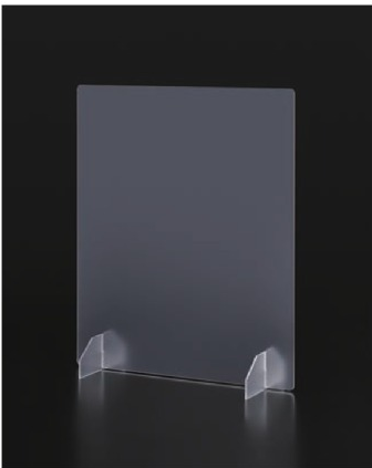
エチケット衝立 すりガラス柄 (台湾製)