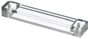
伝票ホルダー (天板用)

8250 W160 (内寸 120) × D35 × H20mm ¥2,500 ※空間部 120 × 10mm