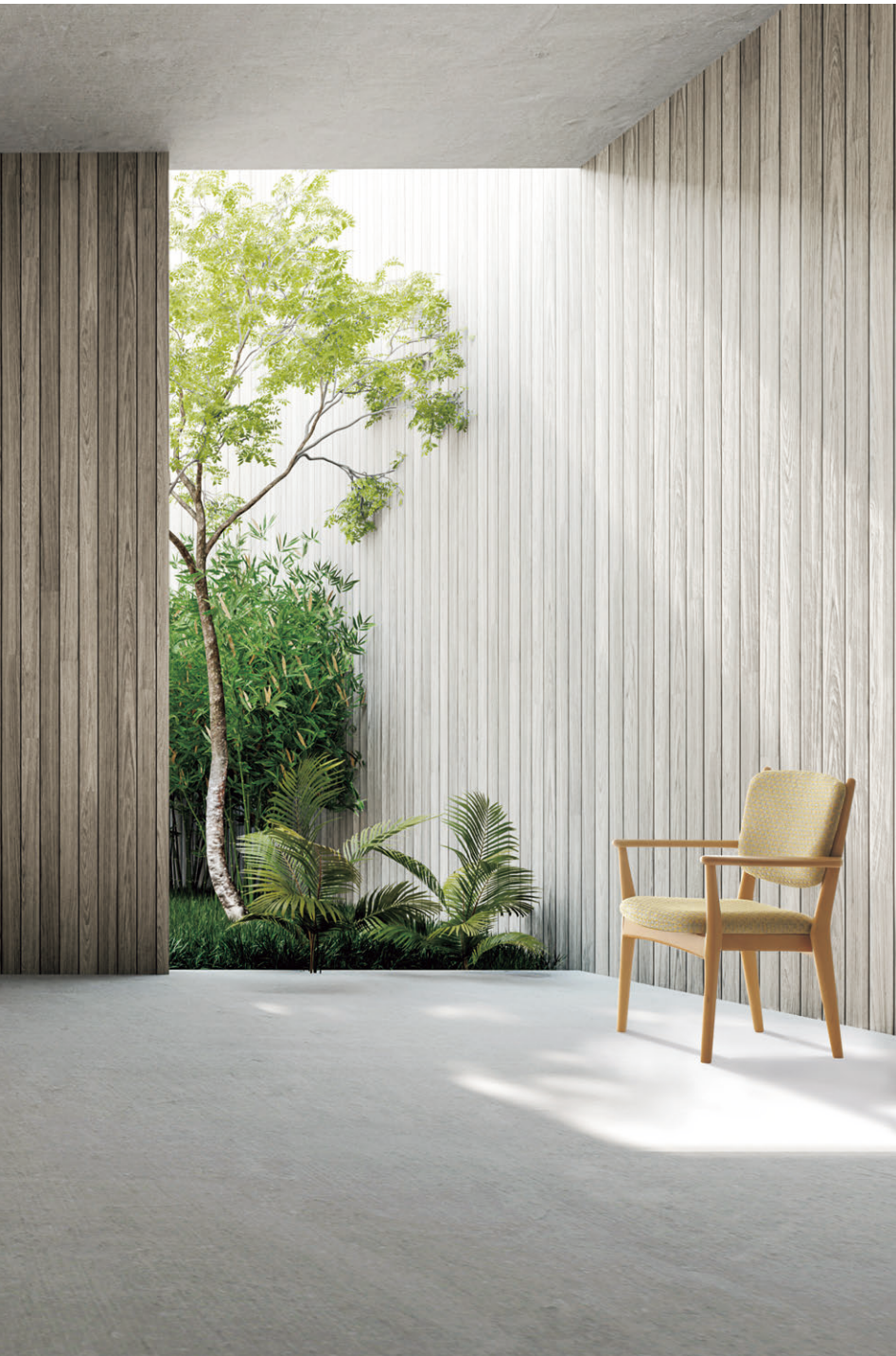
張材：左右/C38-02 →P.225、手前奥/B71-02 →P.221 テーブル：TQNN-942NE ¥148,000(税抜) →P.203