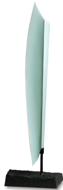
深見 陶治 青白磁 kwan "関"