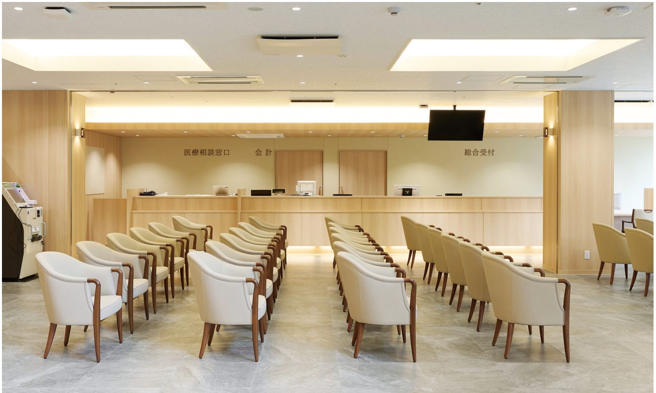
医療法人 愛知会 家田病院