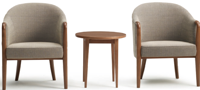
テーブル：LTW-820K7 ¥64,000(税抜) →P.206

腰掛けている間も、立ったり座ったりする際も、 ステッキのように動作中の重心を安定させる木 製の肘掛け。木製ですので、長年使っても汚れに く衛生面にも優れた特徴を持っています。