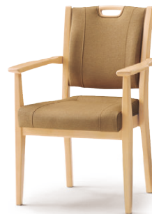
木部カラー：NN(ナチュラル色) 張材：B68-08 →P.216