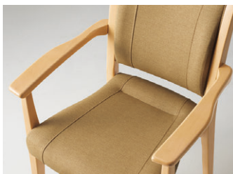
握りやすく、腕をのせられる肘掛け。

サイドサポートや背もたれ、座面など 体幹の安定や体幹を考慮したチェア。 運んだり移動する時に便利な、手掛けを設けました。