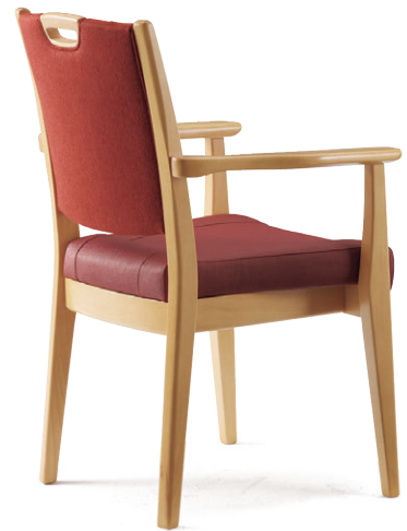
張材：背/B59-06 →P.220、座/B62-07 →P.216