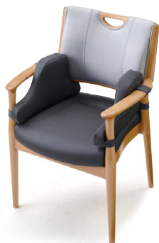
張材：背/C22-16 →P.222、 座・クッション/B30-14 →P.215