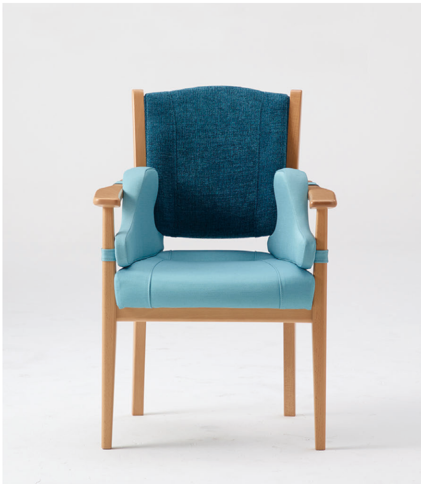
張材：背/B51-04 →P.219、座・クッション/B30-09 →P.215