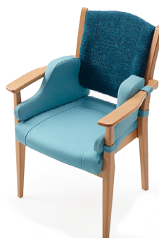
張材：背/B51-04 →P.219、 座・クッション/B30-09 →P.215