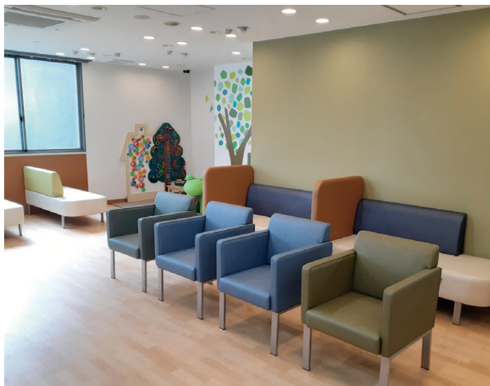
日野みんなの診療所