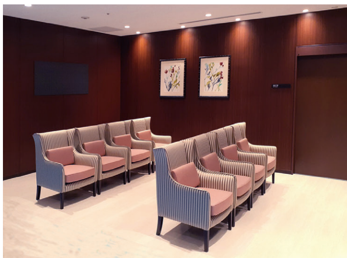
国際医療福祉大学 成田病院