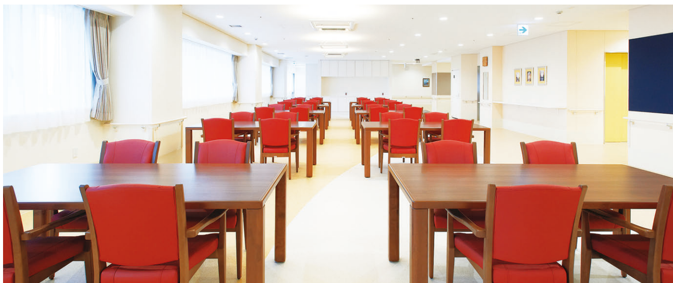
あずまリハビリテーション病院