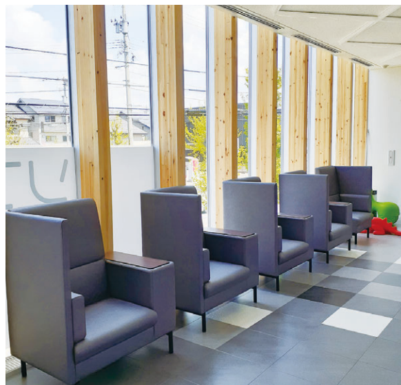
ソフィアひふ科クリニック