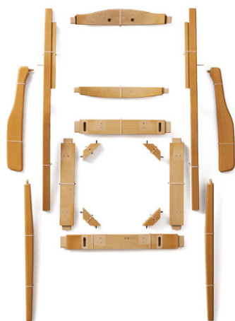
強靱なイスの部材と構造