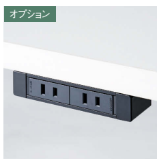
電源コンセント G001E-B ¥15,000 電源コンセント2口 (15A 125V 2mコード付) ※USBタイプもございます。