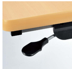
■折りたたみ操作レバー