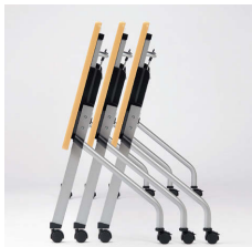
■平行スタッキング

別製対応 …SIAA登録の抗ウイルス・抗菌天板での製作が可能です。詳細はP.013をご覧ください。