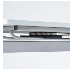
■スチールパイプ棚