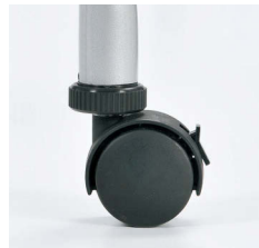
■アジャスト機能付キャスター