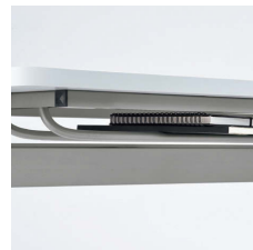
■スチールパイプ棚 書類やファイルなどの収納に便利です。