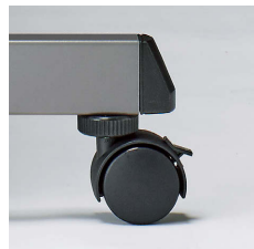
■アジャスト機能付キャスター キャスター上部のリングを回転させる事によりレベル調整が可能です。