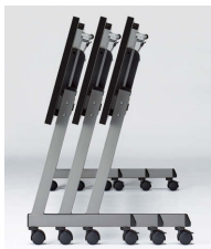
■サイドスタッキング スタックピッチ110mm