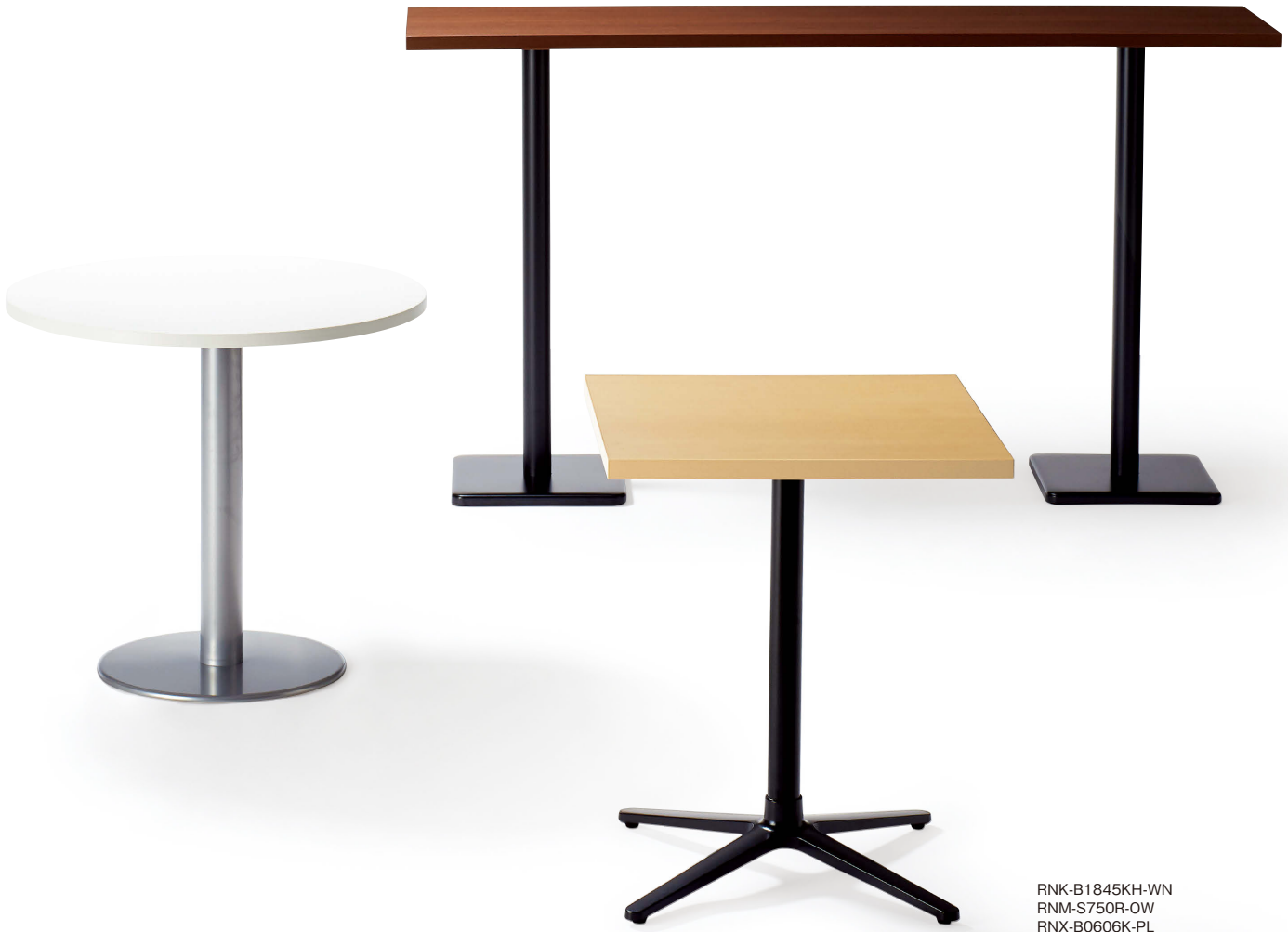
RNK-B1845KH-WN RNM-S750R-OW RNX-B0606K-PL