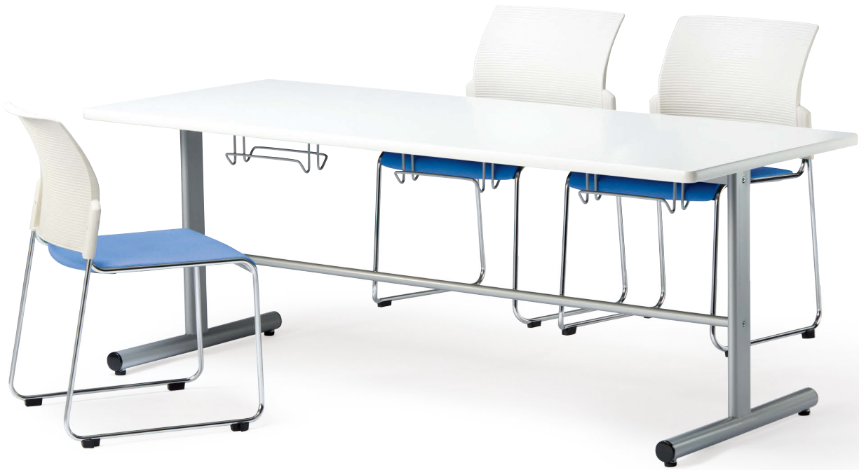
テーブル HGS-1875-WH チェア FC-88VW-BL (P.242)