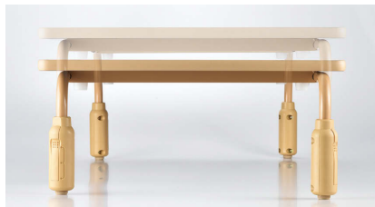
■回転ロック式高さ調節

別製対応 …SIAA登録の抗ウイルス・抗菌天板での製作が可能です。詳細はP.013をご覧ください。