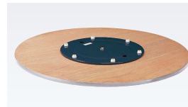
TANタイプ(スチール製回転金具)