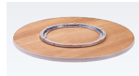
TAAタイプ(アルミ製回転金具)