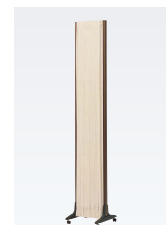
■折りたたんだ状態