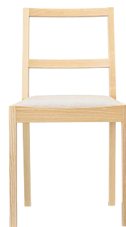
キノイスNA 11892-A D/レザー・フロワ1