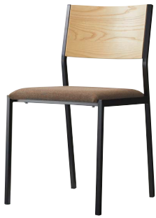
テームイスBL1 21781-A F/布・マレンコT-9327