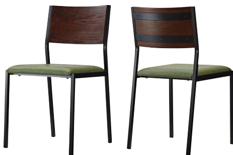
テームイスBL2 21782-A B/レザー・パロン05