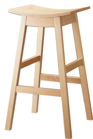
ジミースタンドNA 11927-E 合板シート ¥33,800

テイストを問わず使いやすいデザイン。 座面の仕様は、2パターンからお選びいただけます。