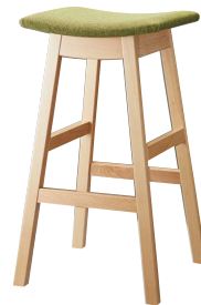
ジミースタンドNA 11930-E ランク外/布・ベス/AT-9262 ¥34,400