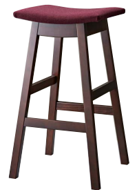
ジミースタンドBR 11931-E F/布・ラット2010