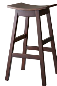
ジミースタンドBR 11928-E 合板シート ¥33,800