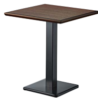
ST969 (BR) -E・BT301-T W600・D600 天板 ¥25,400 脚部 ¥19,000 ベース：クロ塗装・AJ付 ポール：クロ塗装 (組立式)