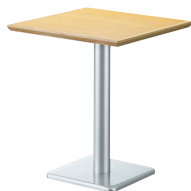
ST969 (NA) -E・BT304-T W600・D600 天板 ¥25,400 脚部 ¥17,000 ベース：アルミ色塗装・AJ付 ポール：アルミ色塗装 (組立式)