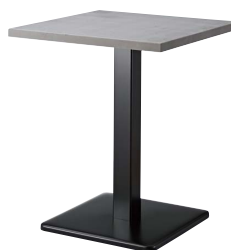
ST993 (CN) -E・BT301-R W600・D600 天板 ¥75,800 脚部 ¥22,000 ベース:クロ塗装・AJ付 ポール:クロ塗装 (組立式)