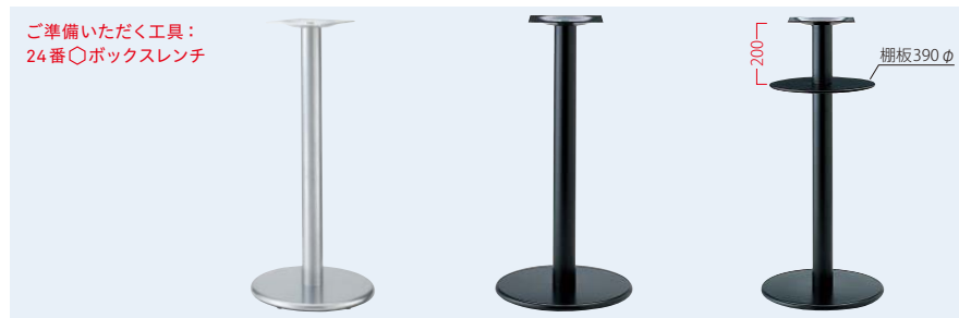
TABLE LEG ハイテーブル用