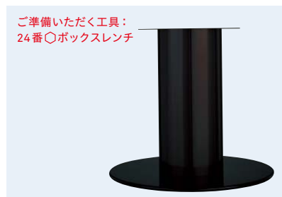
TABLE LEG 丸ベース