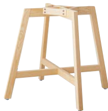
TABLE LEG 4本脚