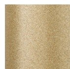
MQ6 [ゴールドメタリック]

※MCL(クリア粉体塗装)・MQ1(黒皮調特殊塗装)は素地がそのまま出るため、磨き痕や溶接部の色が不規則に出ます。