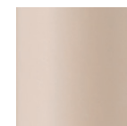
MNA [ナチュラル] 半艶