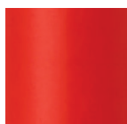
MRE [レッド] 全艶