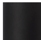
MBK [ブラック] 3分艶