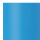
MBL [ブルー] 全艶