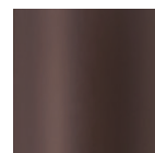
MDB [ダークブラウン] 半艶