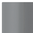
MGR [グレー] 半艶