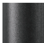
MQ1 [黒皮調] 艶消し