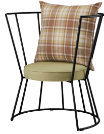
エピゾ MBK ¥133,900 (ツートン張) 張地 座 / 布・エイガ T-9200 ㊦ 背クッション / 布・シグネイチャー T-9226 ㊦