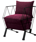
ルチル MBK 張地 / 布・スムージ UP403 ㊦