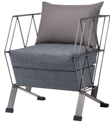
ルチル MCL ¥244,600 (ツートン張) 張地 座 / 布・エイガ T-9201 ㊦ 背クッション / 布・バスタ T-9230 ㊦