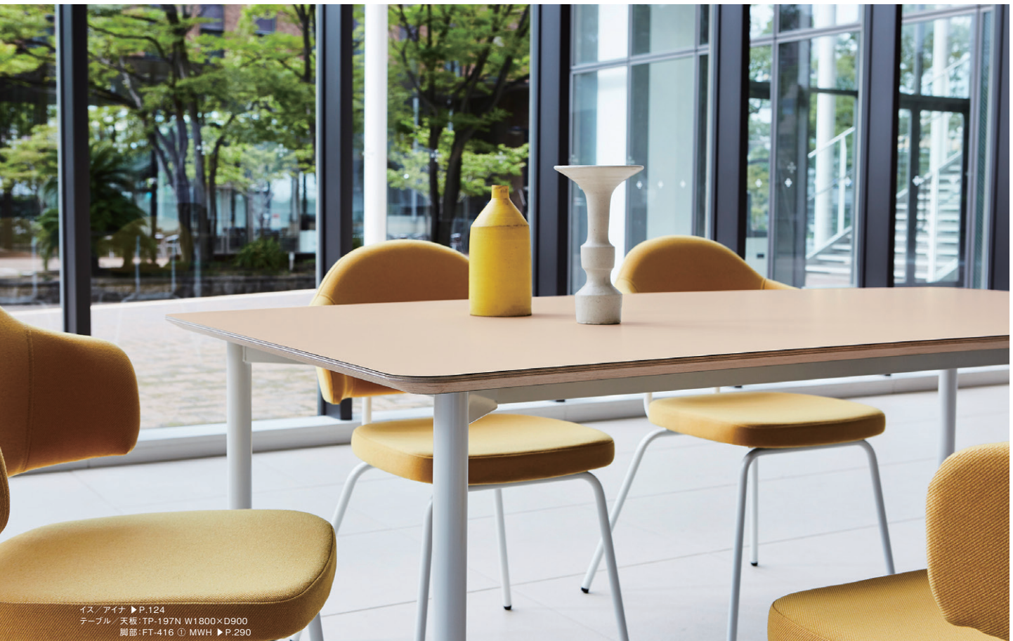
イス / アイナ ▶ P.124 テーブル / 天板: TP-197N W1800×D900 脚部: FT-416 ① MWH ▶ P.290