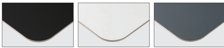
TP-197B TOP / FENIX (0720)