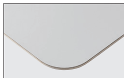
TP-197A TOP / FENIX (0725)