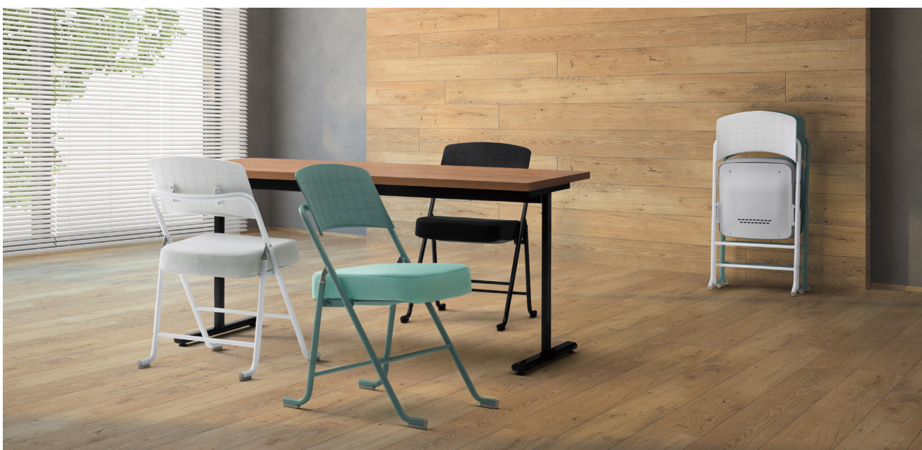
テーブル: TMI590URT >> P163