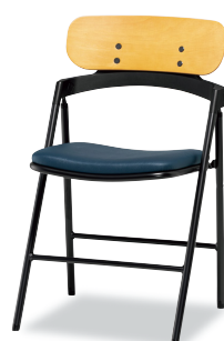
ブラックネイビー