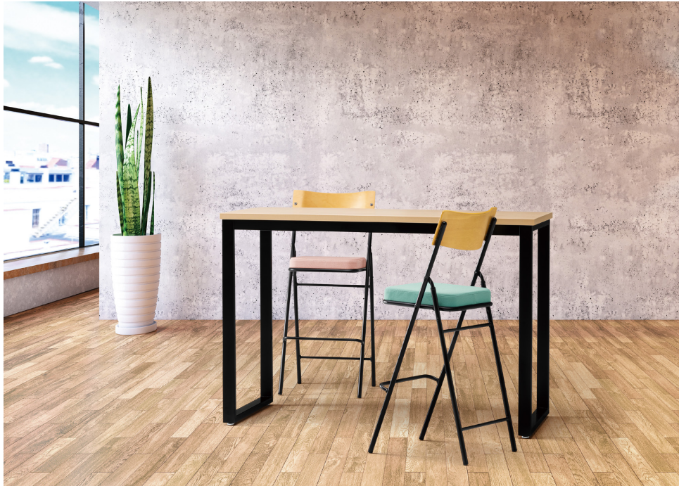
テーブル: RT1575BXH-H ▶▶ P180

座り心地にこだわった厚張り仕様の折りたたみハイチェア 2色の背合板とそれぞれに合わせた張地色で、デザインにもこだわりました