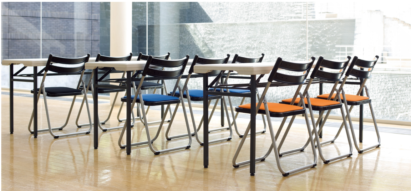
テーブル: TMI43-MZ >> PI67