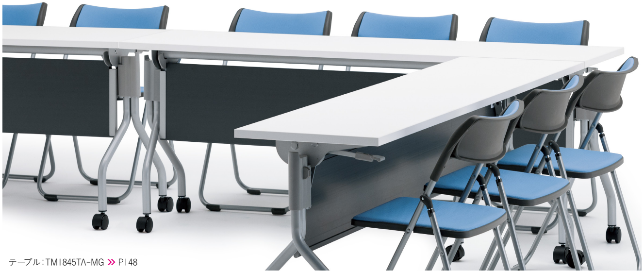
テーブル: TM1845TA-MG >> P148