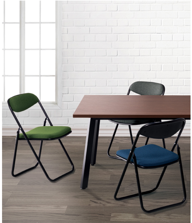
テーブル: TM1890UM-K >> P15