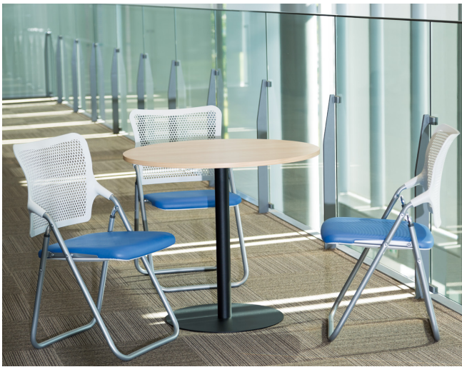
テーブル:RT17-MZA >> P179

快適シート S-fit 搭載で座り心地を追求したニューコンセプト折りたたみチェア