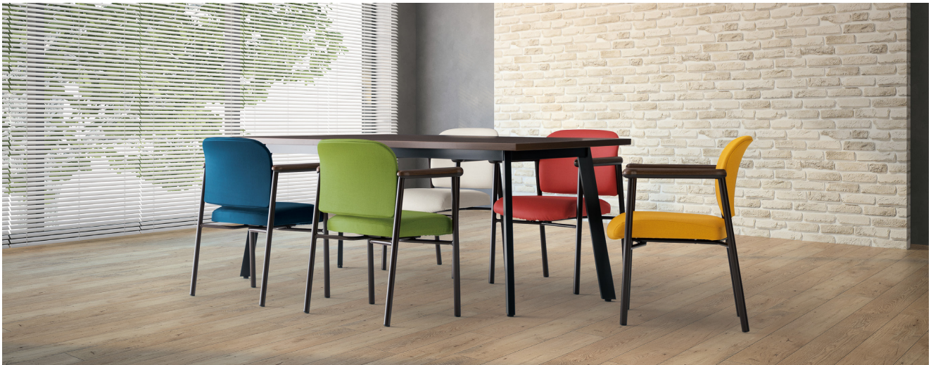
テーブル: TM1890UM-K >> P155

大きな背もたれと超厚張の座。安定感のあるφ 28.6mm フレームに木目調肘が印象的な、椅子本来の機能性能を追求したパーソナルチェア