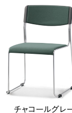
チャコールグレー