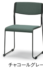
チャコールグレー