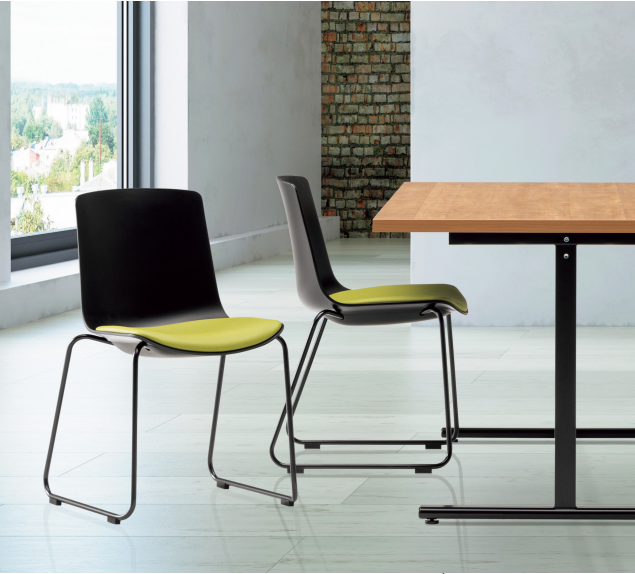
テーブル: TMI590URT >> P163